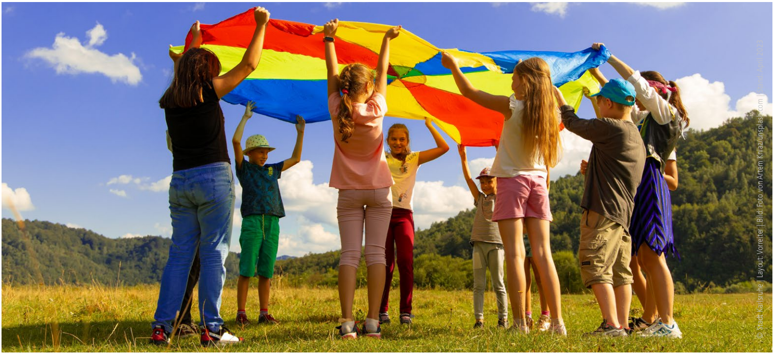
© Stadt Karlsruhe | Layout: Vorreiter | Bild: Foto von Antem Kriaz/funsplash.com | www.kinderbuero.de